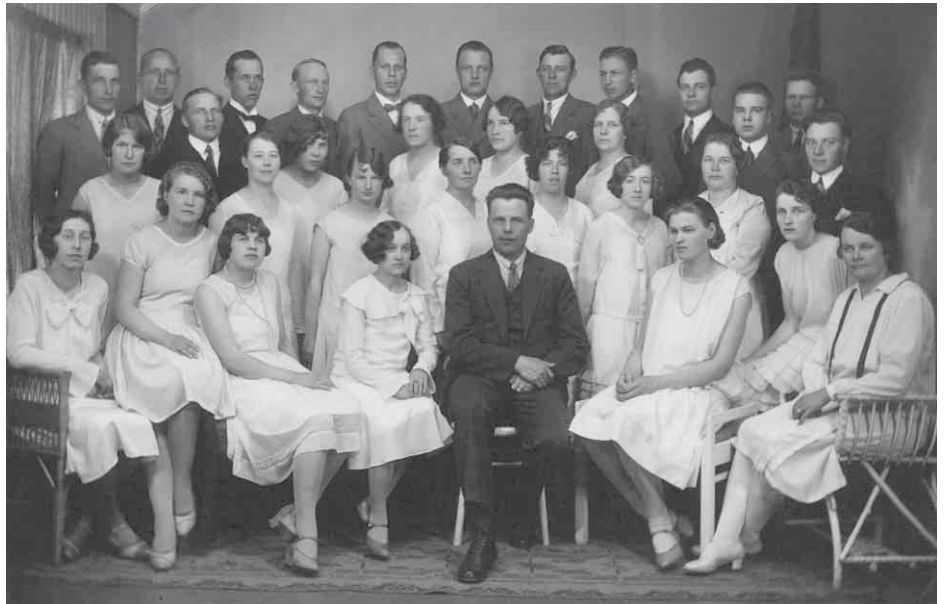
Kokkolan Työväen Sekakuoro 1930-luvulla

Osa 2 sarjasta STM:n vuosikymmenet, jatkoa seuraa syksyn lehdissä.